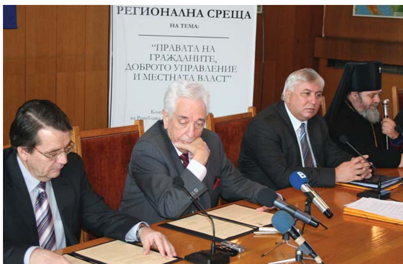
Омбудманът Гиньо Ганев на среща с представители на местната власт в област Велико Търново

на социалните услуги, чрез развиване и предлагане и на такива услуги, които да финансират и със собствени средства или от други източници. Местните власти трябва да съставят собствен дневен ред за развитието на качествени местни социални услуги, достъпни за всички. Нови възможности се откриват чрез кооперирането между общините на регионален принцип, областно планиране на услуги и споделяне на добре практики.