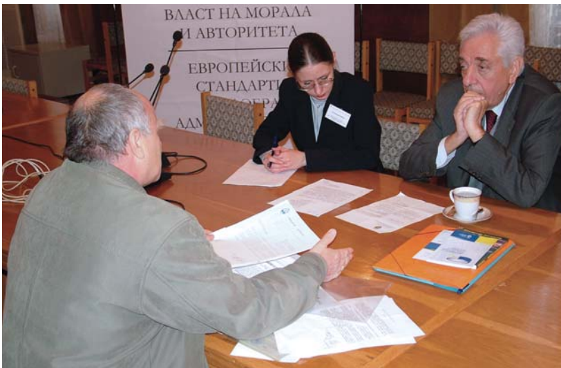
Омбудманът Гиньо Ганев и експерти от неговия екип приемат жалби на граждани в рамките на Временна приемна в Бургас