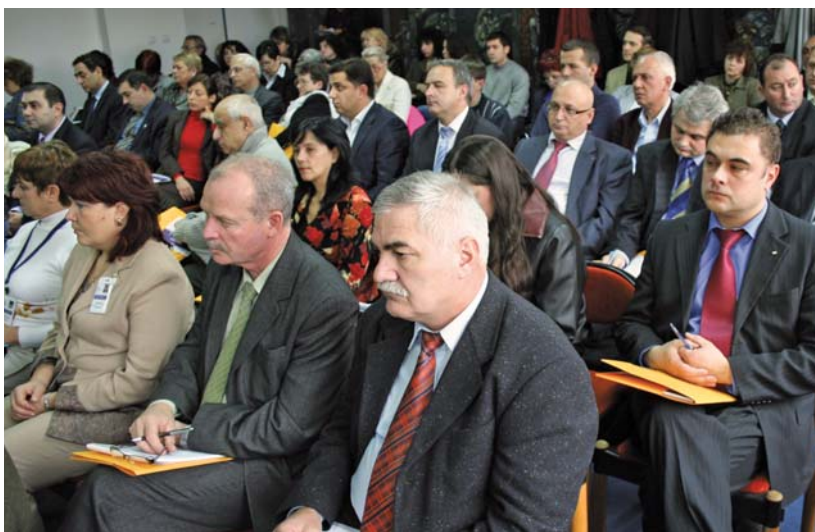
Регионална среща на омбудмана на Република България Гиньо Ганев с представители на общините от област Пловдив

сят както в незаинтересоваността на самите граждани, така и в липсата на достатъчно информираност и публичност на управленските политики на общините. В общия случай, Въпреки че над 85 % от общините посочват, че публично се оповестяват датите на заседанията на общинския съвет, възможностите за изказване на граждани и участие на журналисти, приемното време на кмета, отчета за дейността на кмета, дългосрочни и средносрочни про-