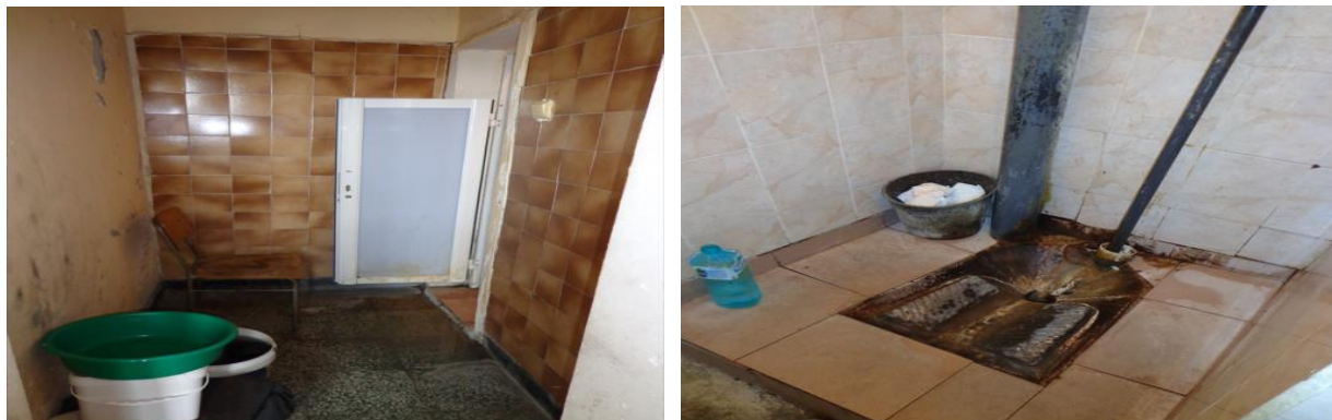
Санитарни помещения в Арест Свиленград

Храната се осигурява чрез кетъринг, като лицата имат възможност с техни лични средства да си набавят допълнително хранителни продукти. Осигурено е диетично хранене за лицата с медицински показания.