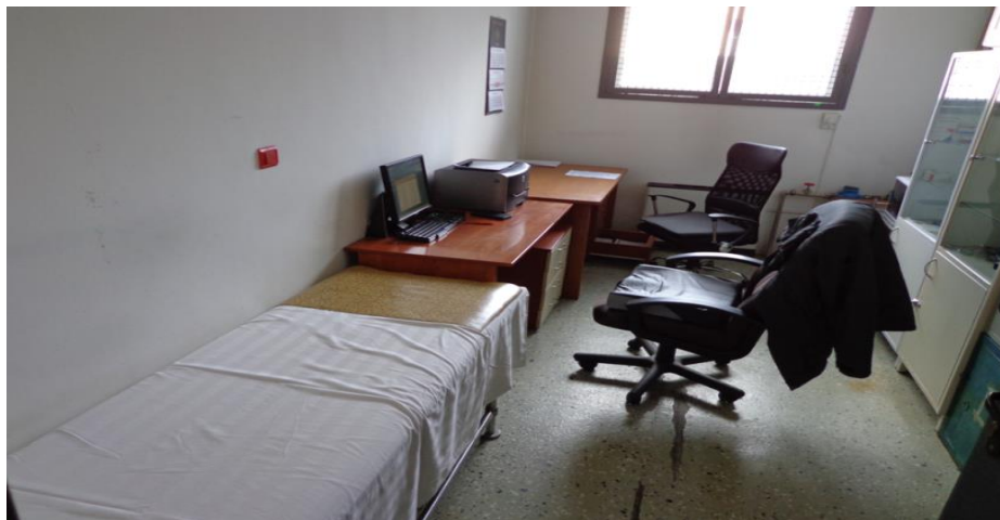
Медицински кабинет в Арест Елхово

Лекарствата за настанените лица се закупуват от фелдшера от аптека в гр. Ямбол.