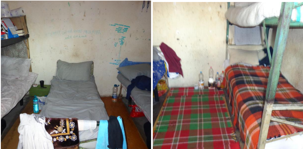
Килии за настаняване на задържани лица в Арест Хасково

Съгласно представения отчет за дейността на Районна служба „Изпълнение на наказанията“ гр. Хасково през 2023 г. в ареста е регистриран един случай на опит за самоубийство . По информация от администрацията на ареста, надзирателите, които са били на смяна в този ден, са открили примка, направена от дреха на леглото на задържания. Той си я бил сложил около врата, но неговия съкилийник му попречил да извърши самоубийство, като сигнализирал надзорно-охранителния състав. Длъжностните лица са предприели незабавни действия за опазване на живота и здравето на задържаното лице. Веднага са повикали екип на Спешна медицинска помощ, който не е установил наличието на видими следи от затягане на примката по врата на лицето. Длъжностните лица информираха, че не са виждали задържания с поставена примка. Същата я заварили оставена на леглото му.