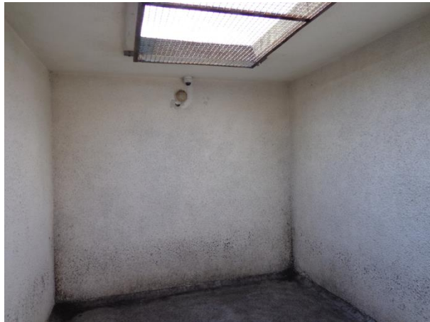
Помещението за каре