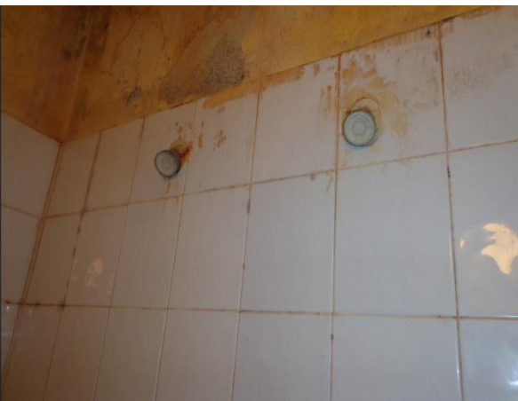
Банята в Арест Елхово

Храната за задържаните лица се осигурява чрез външен доставчик, която се предоставя три пъти дневно преди времето за хранене. Разпределението се извършва в специално обособената за това разливна, оборудвана с хладилник за съхранение на храната и кухненски уреди. Храната се изготвя по седмично меню, разнообразна е, със съдържание на месо, риба, млечни продукти, пресни плодове и зеленчуци и е достатъчна като калориен състав съобразно утвърдените от министъра на правосъдието таблици.