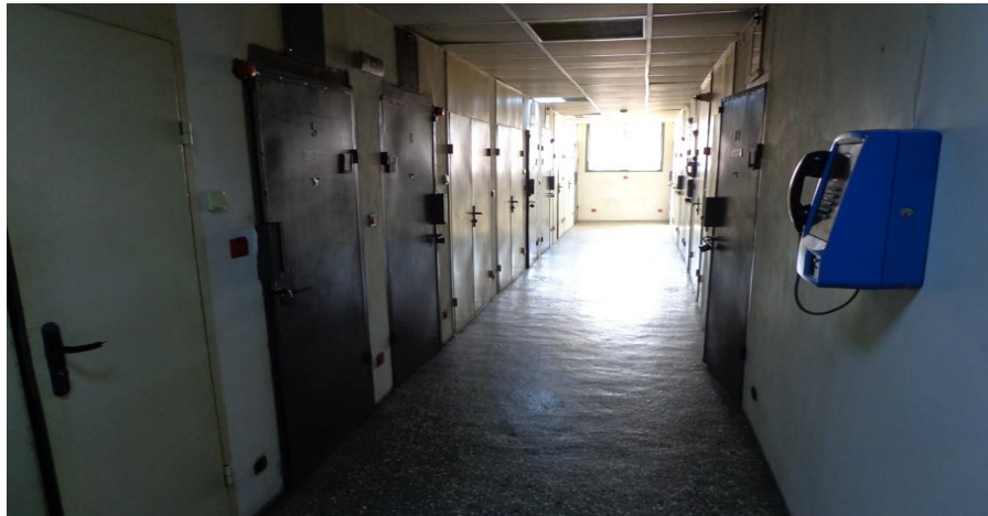
Коридорът, в който са килиите за настаняване на задържани лица