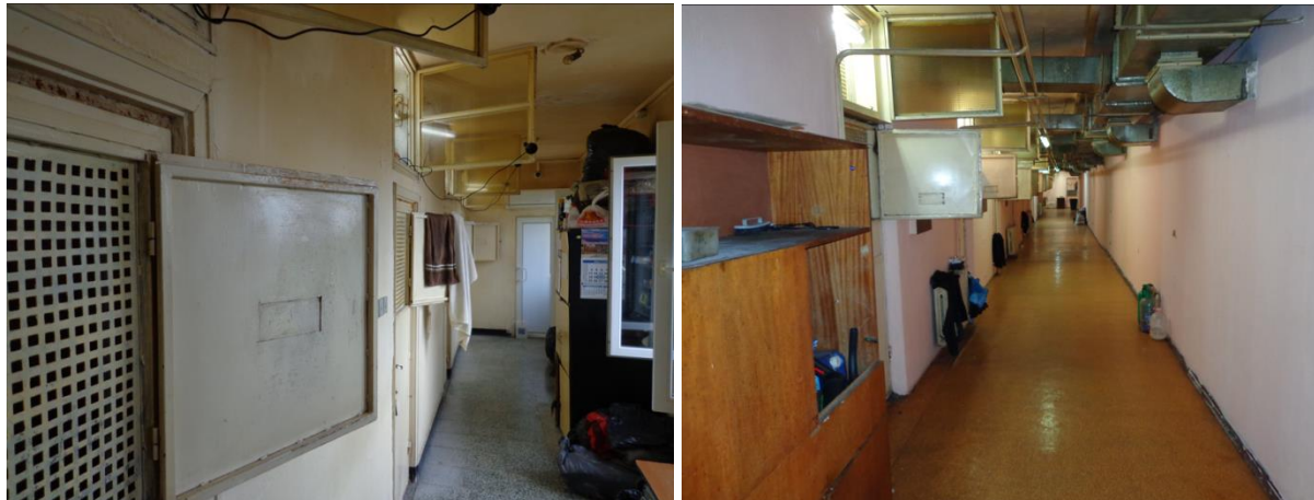
Коридорите, където се намират помещенията за настаняване в Арест Хасково