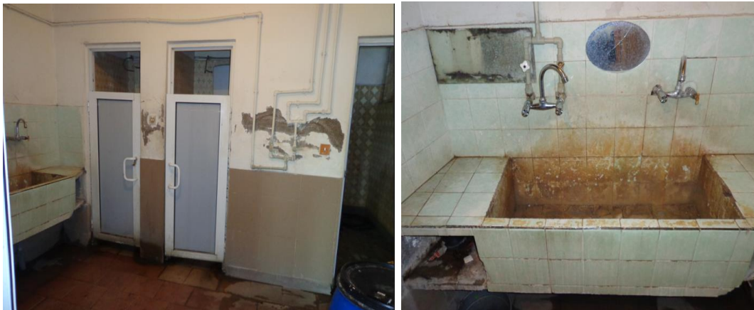
Банята в Арест Хасково