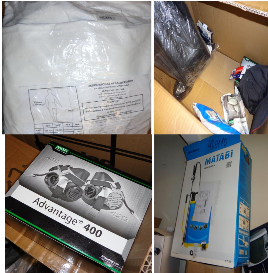
Екипировка и оборудване на обучените служители в Арест Хасково за пръскане срещу вредители

Въпреки видимото преодоляване до голяма степен на проблема с вредителите, проверяващият екип установи, че в обекта продължава да има наличие на дървеници, както в помещенията за настаняване, така и по стените на външните коридори. По задържаните лица имаше видими следи от ухапвания.