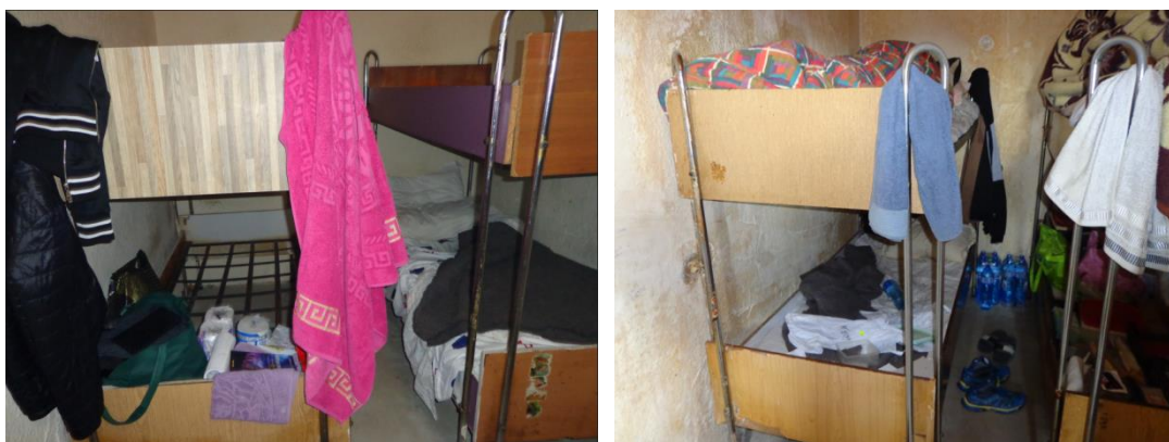
Помещения за настаняване на задържани в Арест Свиленград

Арестът в гр. Свиленград се намира на втория етаж в сградата на РУП, находяща се в гр. Свиленград, ул. „Крайречна“ № 1. Той се състои от коридор с прозорци със западно изложение и пет килии. В началото на коридора откъм северната страна се намира стая на дежурния по арест и командира на отделение, а в дъното на южния край – санитарен възел с баня и тоалетна за задържаните лица.