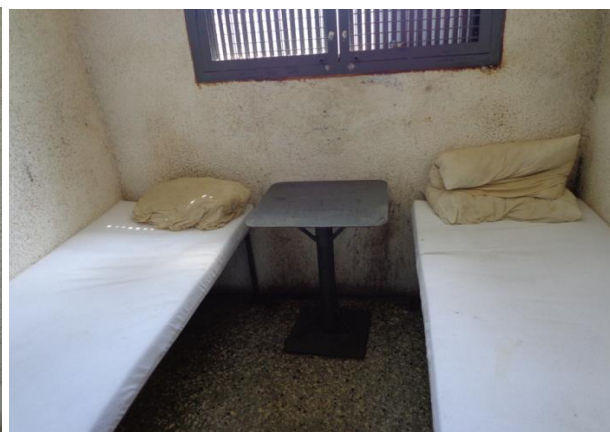
Помещения за настаняване на задържани лица