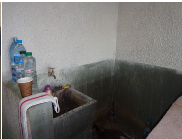
Санитарни възли в помещенията за настаняване