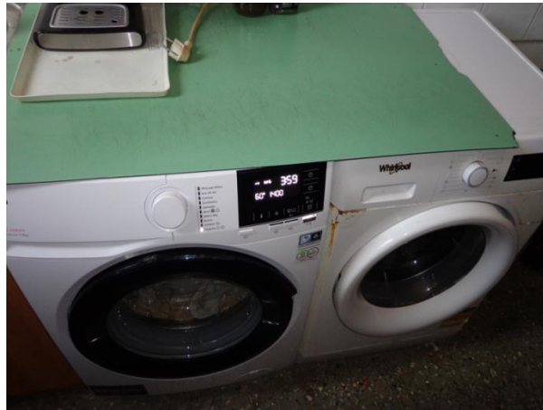
Пералня и сушилня в Арест Елхово