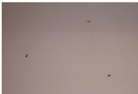
Дървеници по стената на коридора