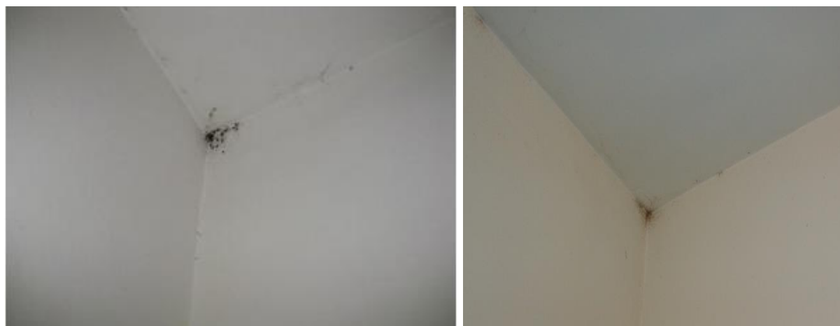
Наличие на хлебарки в ареста през м. юли 2023 г.