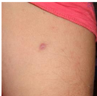
Ухапване от дървеници

Въпреки видимото преодоляване до голяма степен на проблема с вредителите, проверяващият екип установи, че в обекта продължава да има наличие на дървеници, както в помещенията за настаняване, така и по стените на външните коридори. По задържаните лица имаше видими следи от ухапвания.