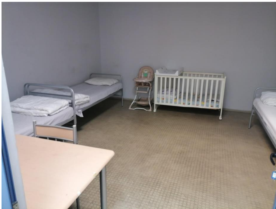
Стаята с бебешко креватче и столче без пряк достъп до естествена светлина

Във всички стаи имаше ток, а санитарното помещение беше оборудвано с тоалетна, душ, сапуни, тоалетна хартия и хартиени кърпи за ръце.