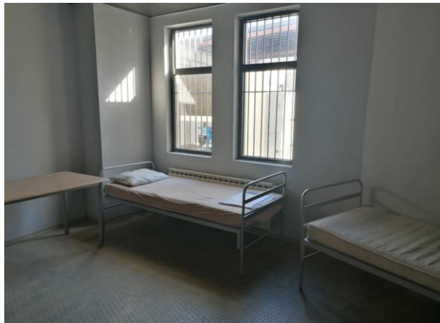
Други стаи за настаняване на недопуснати чужди граждани

В санитарното помещение не се констатира липса на водоснабдяване.