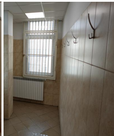
Банята в Ареста на ОСИН - Благоевград

Храната за настанените в обекта лица се осигурява чрез кетъринг по три пъти на ден от лицензирано търговско дружество. Изпълнителят доставя хранителните продукти за закуска, обяд и вечеря в сградата на следствения арест и се приема от съответното длъжностно лице от надзорно-охранителния състав.