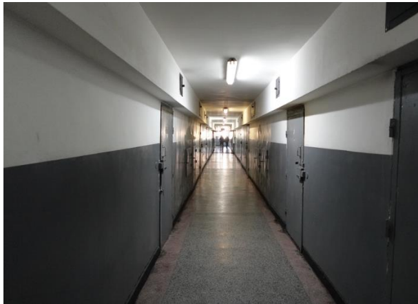
Коридор на етаж със спални помещения