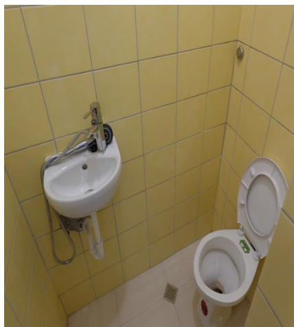
Санитарен възел за жени