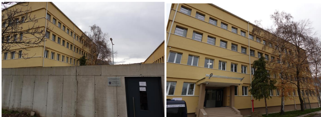
Следствен арест към РСИН-Кюстендил

Днес, обектът е разположен в изцяло ремонтирана и санирана четириетажна сграда, оградена с висока бетонна ограда. Преместването на ареста е осъществено с реализирането на Проект „Осигуряване на сигурна и безопасна материална среда в затворите и арестите“, който се изпълнява по Договор за безвъзмездна финансова помощ с № 93-00-27/29.01.2020г. и по Програма „Правосъдие“, с финансовата подкрепа на Норвежкия финансов механизъм 2014-2021 г.