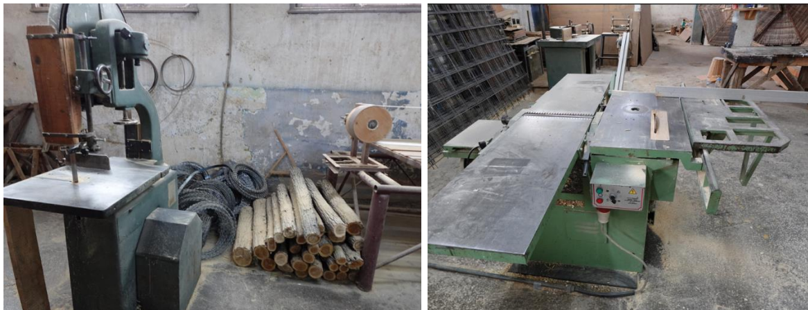
Дърводелски цех в Затвор Бобов дол

Обектът е оборудван с необходимите основни и специализирани машини, ръчни инструменти, и специални приспособления за изпълнението на безопасни условия на труд.