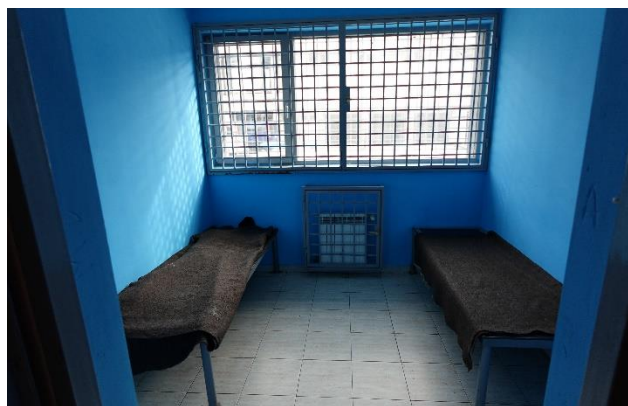
Стаята за непълнолетни

В стаята за настаняване на непълнолетни има и сигнален бутон за повикване на дежурното длъжностно лице при необходимост.