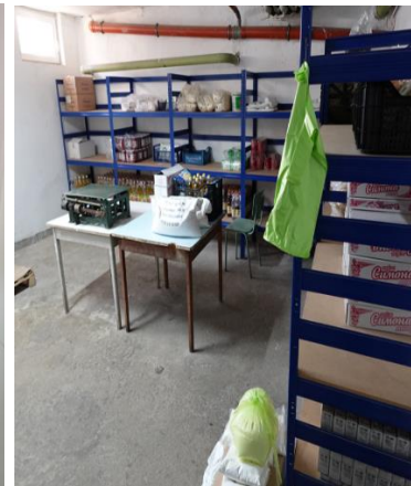
Склад за хранителни продукти

При обиколка на кухнята и складовете за хранителни продукти, екипът на омбудсмана констатира наличието на видими щети по част от стените и тавана, вероятно причинени от теч и влага.