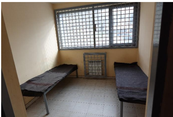
Помещение за задържане