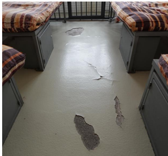
Подова настилка с видими щети

Предвид горното, омбудсманът на Република България отправя препоръка до началника на следствения арест към ОСИН-Благоевград да бъдат извършени необходимите ремонтни дейности за поправяне на подовите настилки в спалните помещения.