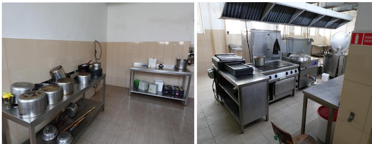
Кухнята в Затвор Бобов дол

Затвор Бобов дол разполага с голяма кухня, която е оборудвана с необходимите съоръжения за приготвянето на различни видове ястия. Хранителните продукти се съхраняват в специални складове, а тези които трябва да се съхраняват при ниски температури се разпределят в хладилни камери, хладилници и фризери. Менюто е разнообразно, като се водят отделни списъци за лицата, които е необходимо да спазват определителни хранителни режими поради здравословни или други причини.