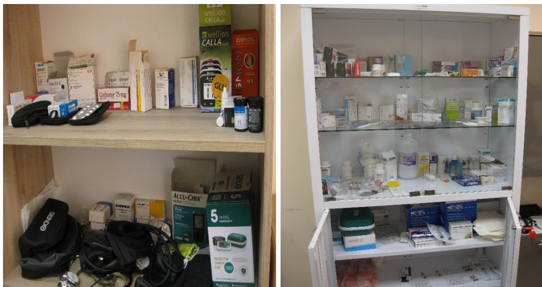
Лекарствени продукти, мед. апарати и спешен шкаф

При извършената проверка в кабинета е констатирана наличност на лекарствени продукти и консумативи, съхранявани в спешен шкаф, които са в срок на годност, както и лекарствени продукти на задържаните. Последните се закупуват от ареста, а донесени от роднините се одобряват от лекаря. Предоставянето им на задържаните става по дози, срещу подпис.