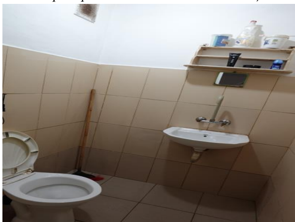
Санитарен възел в спално помещение