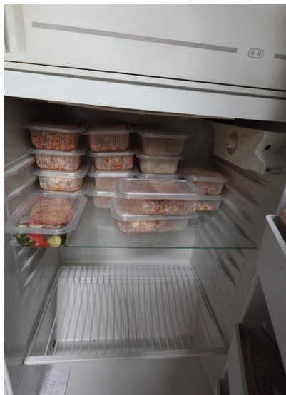
Хладилник с хранителни проби