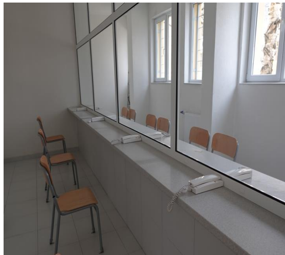
Помещение за свиждания

Срещите и свижданията на задържаните лица се провеждат само в специално обзаведените за това помещения на територията на ареста.