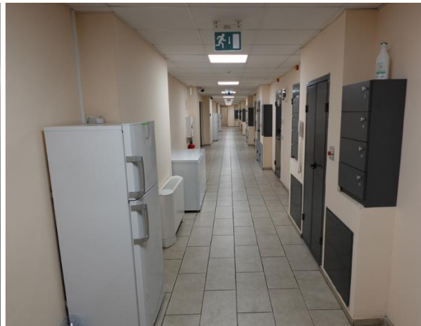
Коридорът при спалните помещения