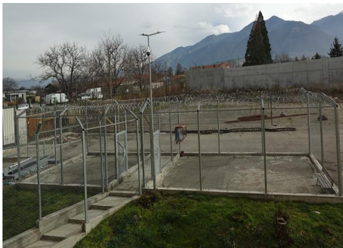
Престой на открито

Всички лица, дошли на свиждане, се придружават през цялото време от служител от надзорно-охранителния състав до напускане на територията на ареста.