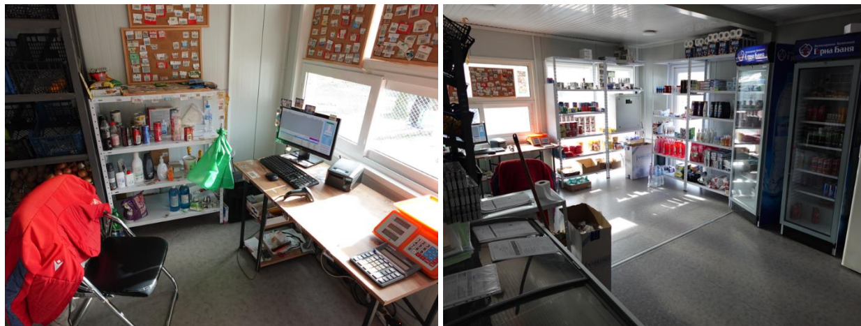
Лавката в Затвор Бобов дол

затворническият корпус. При настоящата проверка, екипът на омбудсмана констатира, че тя е преместена в отделна постройка, находяща се до местата за престой на открито. Според ръководството на затвора това е довело до облекчаване на работата на служителите от надзорно-охранителния състав и е осигурило възможност за осъществяване на по-стриктен контрол при пазаруването от осъдените и задържани лица.