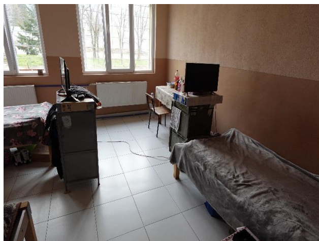
Спално помещение при проверката 2025 г.

Проверяващият екип констатира, че са подновени всички легла с нови, поставени са нови дюшеци, нови радиатори, подменена е дограмата. Извършено е и освежително преобоядисване на всички спални помещения и общите помещения.