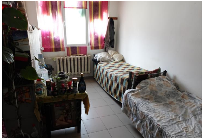
Спално помещение в Затвор Бобов дол