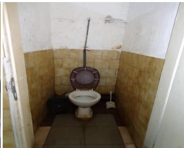
Санитарен възел при проверката 2023 г.

Спалните помещения на ЗО „Самораново“ са разположени на два етажа. В хода на извършената проверка екипът на НПМ установи, че се спазват нормативните изисквания за минимална жилищна площ от 4 кв. м. за всеки лишен от свобода и не се констатира пренаселеност.