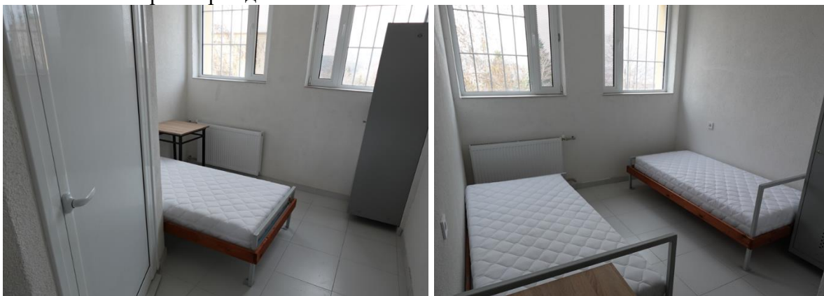
Единично и двойно спално помещение в Следствен арест към РСИН-Кюстендил

Към момента на проверката в ареста бяха настанени общо 13 задържани лица, всички пълнолетни български граждани от мъжки пол.