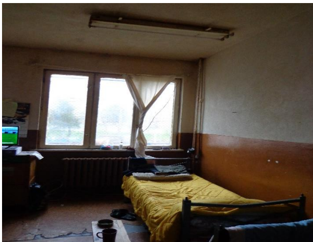
Спално помещение при проверката 2023 г.