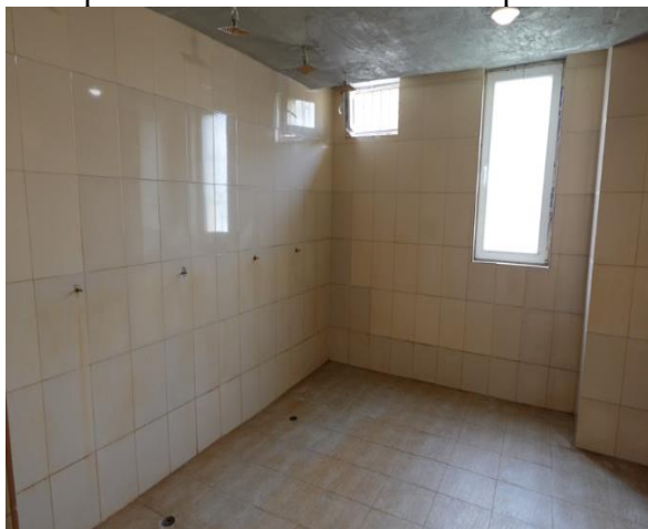
Обща баня в затворническия корпус

Отоплението на Затвор Бобов дол се осигурява от два намиращи се на място котли с газол, а топлата вода се осигурява от два бойлера. От администрацията споделиха, че бойлерите и котлите са много стари и е необходимо да бъдат заменени с нови.