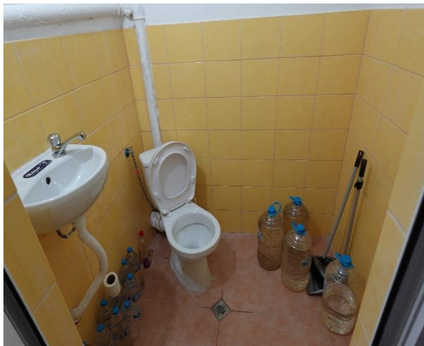
Санитарен възел при проверката 2025 г.