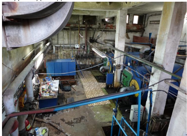
Котелното помещение в Затвор Бобов дол