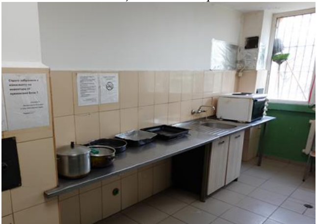
Кухненско помещение за лишениите от свобода

В сградата на затворническия корпус има и обособено помещение за фитнес, оборудвано с необходимите уреди за тренировки и поддържане на добра физическа форма за лишениите от свобода.