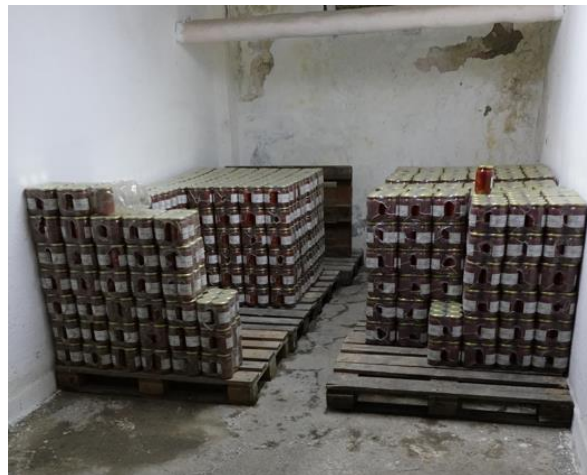
Видими щети по тавана и стените в кухнята и хранителните складове

Предвид горното омбудсманът на Република България отправя препоръка до началника на Затвор Бобов дол да бъдат предприети необходимите действия за идентифициране на причините за появата на тези щети и да се извършат нужните ремонтни дейности.