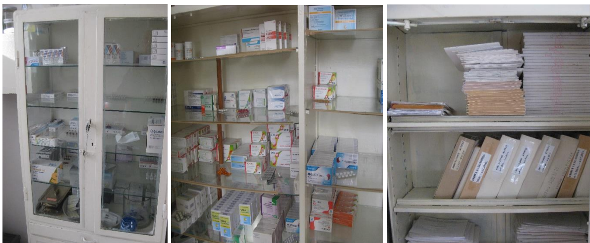
Спешен шкаф, лекарствени продукти и картотека с мед. документация

Медицинският фелдшер води амбулаторен журнал, в който вписва резултатите от извършените прегледи. Лекарствените продукти на лишените от свобода им се раздават срещу подпис. На новопостъпилите лишени от свобода, както и на изолираните в наказателна килия, прегледите се извършват от медицинския фелдшер.