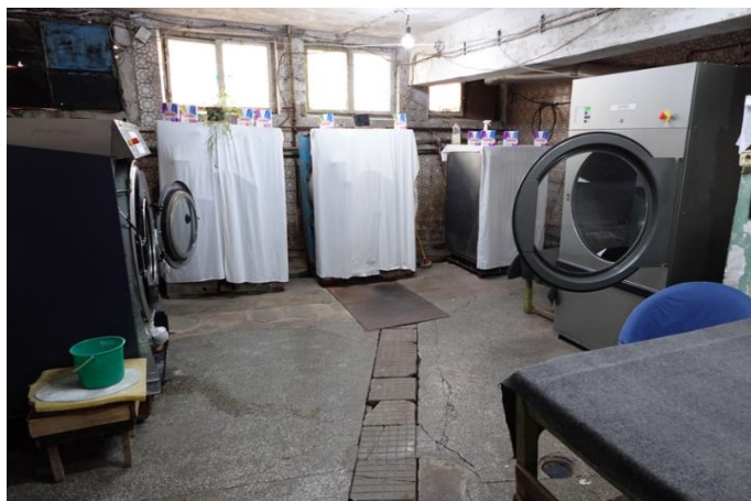
Пералното помещение в Затвор Бобов дол

Омбудсманът на Република България отправя препоръка до главния директор на Главна дирекция „Изпълнение на наказанията“ да бъде извършена техническа експертиза на неползваните перални и сушилни. В случай, че същите не могат да бъдат възстановени и въведени отново в експлоатация да бъдат заменени с нови.